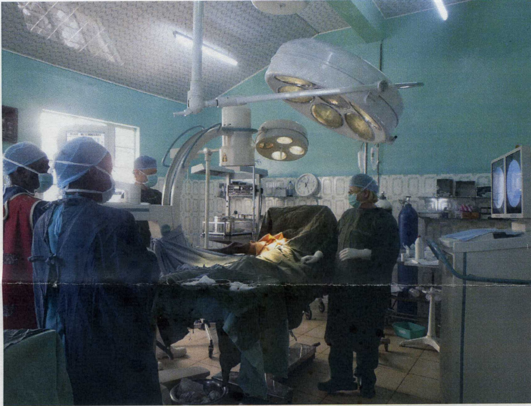
Il nuovissimo amplificatore di brillantezza, in funzione durante un intervento chirurgico